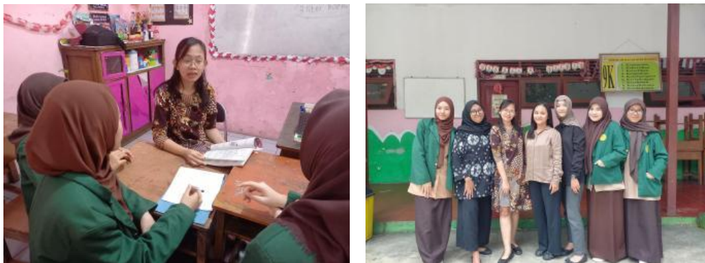
Gambar 2. Dokumentasi saat Wawancara di SDS Budi Wanita

Temuan lapangan menunjukkan bahwa guru di SDS Budi Wanita berusaha menanamkan nilai toleransi melalui diskusi kelompok dan pemanfaatan media digital. Hal ini mencerminkan praktik pembelajaran transformatif sebagaimana dikemukakan Mezirow (2009), di mana perubahan perspektif siswa dibentuk melalui pengalaman bermakna dan refleksi kritis. Selain itu, komitmen guru menciptakan ruang belajar inklusif sesuai dengan prinsip keadilan sosial dalam pendidikan (Saing et al., 2023), di mana semua siswa dihargai tanpa memandang latar belakang budaya. Nilai-nilai humanistik pun tercermin dari pendekatan guru yang menempatkan siswa sebagai subjek aktif, bukan objek pasif, sesuai gagasan Carl Rogers dan Maslow dalam teori humanistik.