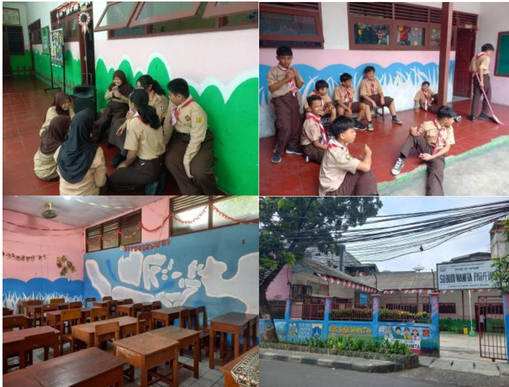
Gambar 3. Dokumentasi Lingkungan di SDS Budi Wanita