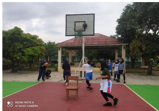
Gambar 1. Pelaksanaan Program Pengabdian Masyarakat