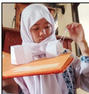
Gambar 3. Responden 3 Mencoba dan Mengamati Media PopRu

Responden mengusulkan perbaikan desain PopRu dari segi bentuk, kerapian jaring-jaring, dan warna agar lebih menarik bagi siswa. Selain itu, ada harapan pengembangan media pembelajaran berbasis teknologi digital, misalnya dikombinasikan dengan proyektor atau kuis interaktif agar pembelajaran lebih bervariasi dan tidak monoton.