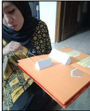
Gambar 4. Responden 4 Mencoba dan Mengamati Media PopRu

Responden berharap adanya perbaikan pada bagian jaring-jaring PopRu agar bentuk bangun ruang lebih presisi saat dibuka. Ia juga menginginkan media pembelajaran yang tetap berbasis visual dan interaktif seperti PopRu karena dianggap membantu pemahaman cepat. Visualisasi yang menarik dinilai sangat penting untuk meningkatkan kualitas pembelajaran matematika.