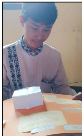
Gambar 2. Responden 2 Mencoba dan Mengamati Media PopRu

Responden menyarankan agar media PopRu ditingkatkan dari segi kualitas bahan dan desain warna, agar lebih tahan lama dan menarik. Selain itu, terdapat harapan pengembangan berbasis teknologi digital, seperti versi interaktif yang menggabungkan media fisik dengan elemen digital.